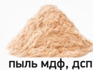
пыль мдф, дсп